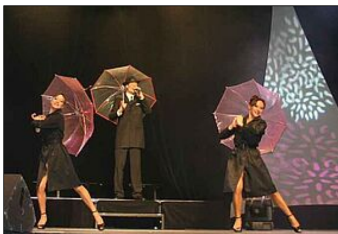
Spectacle de Noël pour les retraités lorientais