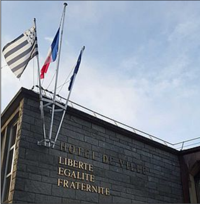
Conseil municipal de Lorient