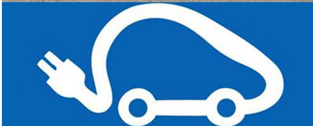
Bornes de recharge

Situer toutes les bornes de recharge pour les wattures à Lorient Consulter le plan