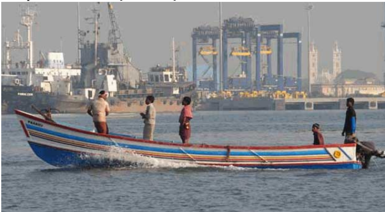
Cochin La plus grande ville du Kerala (Inde)