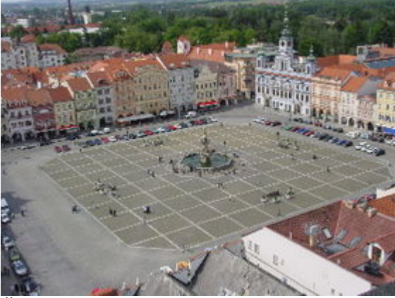
České Budějovice en Bohême-du-Sud (République tchèque)