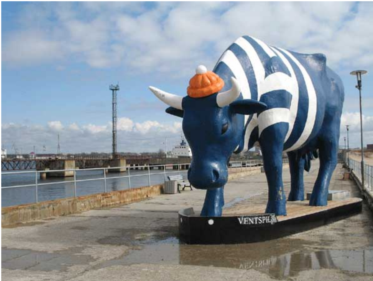
Ventspils La vache bleue du port de Ventspils (Lettonie)