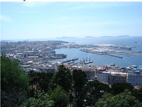
Vigo Premier port de pêche européen, en Galice (Espagne)