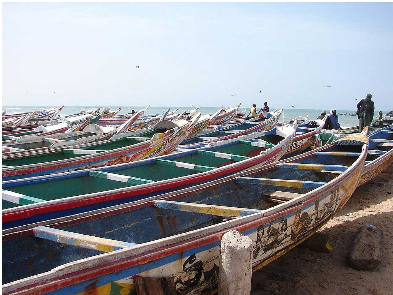
Les barques à Cayar (Sénégal)