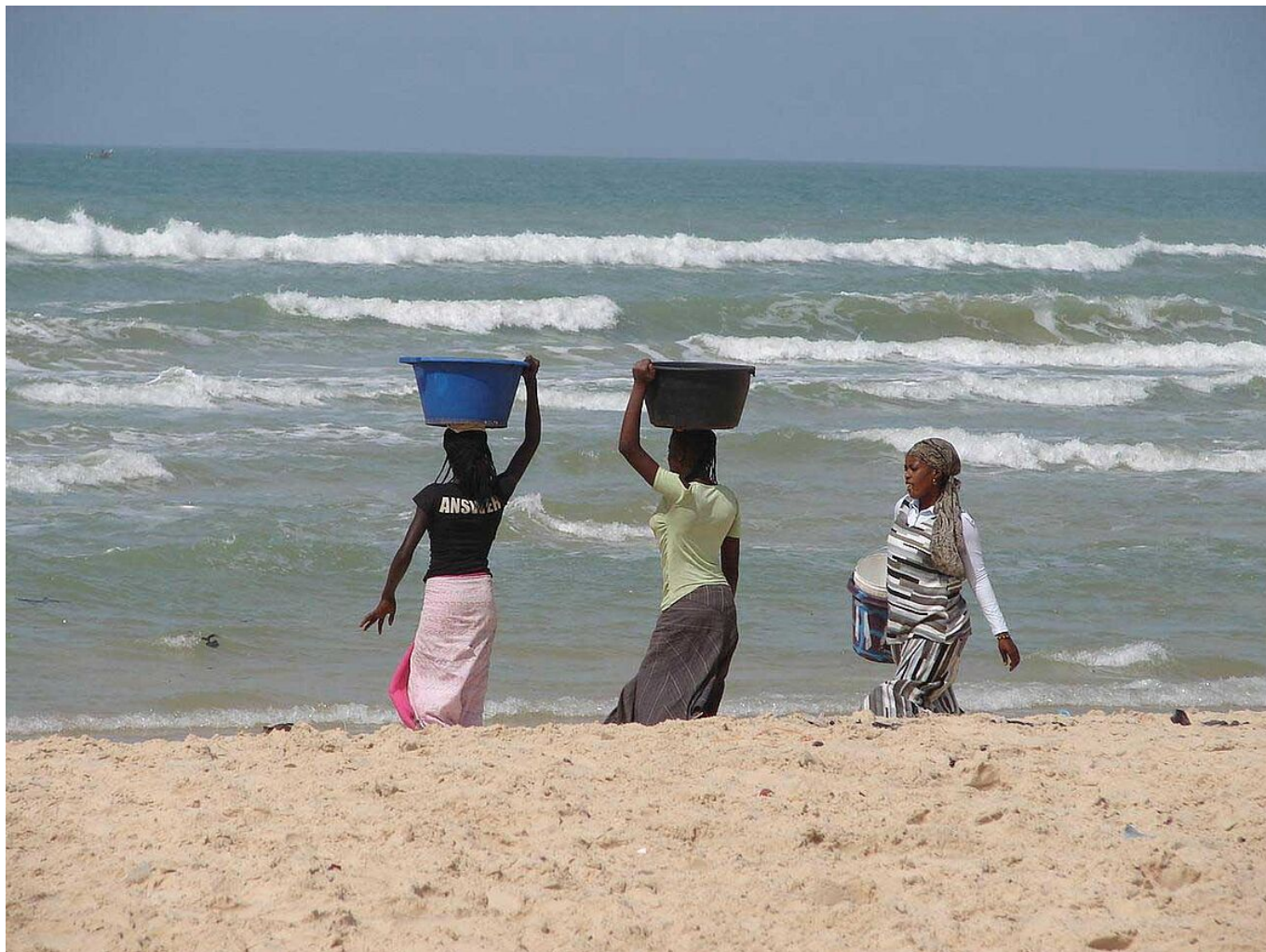
Femmes sur la plage à Cayar (Sénégal)

différents organismes sénégalais, dont l'ONG Enda qui assure la formation du comité de gestion de l'équipement.