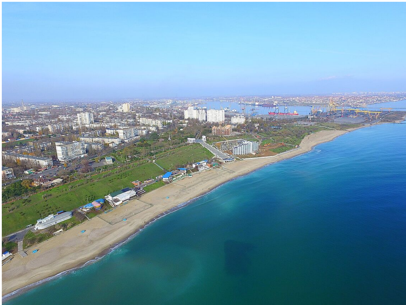
Le littoral de la ville de Tchernomorsk, en Ukraine.