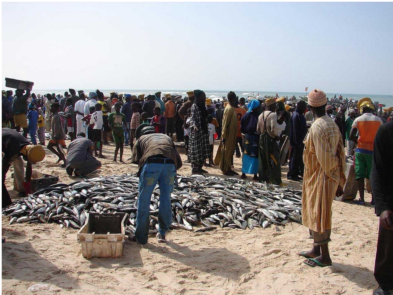
Retour de pêche, tri du poisson sur la plage à Cayar (Sénégal)