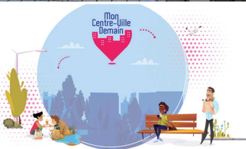
Mon centre-ville demain