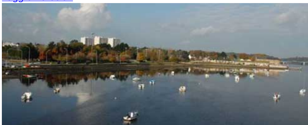
Rénovation urbaine à Bois-du-Châteauretenu comme programme d'intérêt national