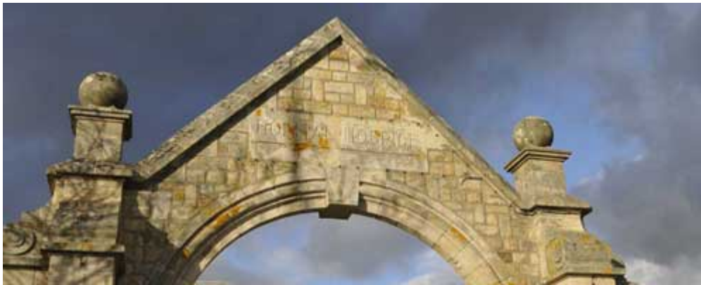
Quartier Bodelio - sur le site de l'ancien hôpital