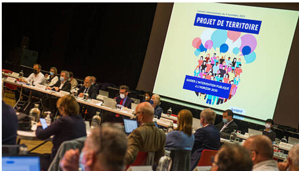
Projet de territoire de l'agglomération