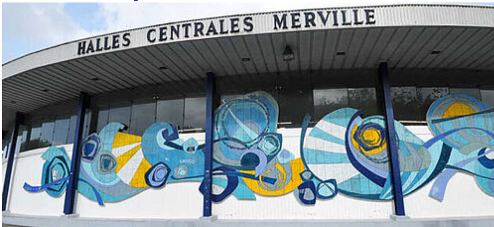
Rénovation des halles de Merville