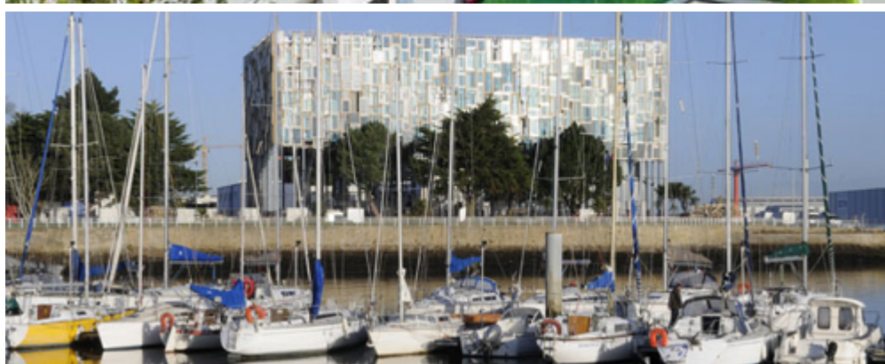
Enclos du port - Péristyle