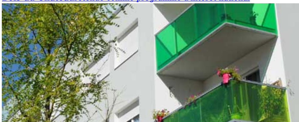
ORU de Kervénanec