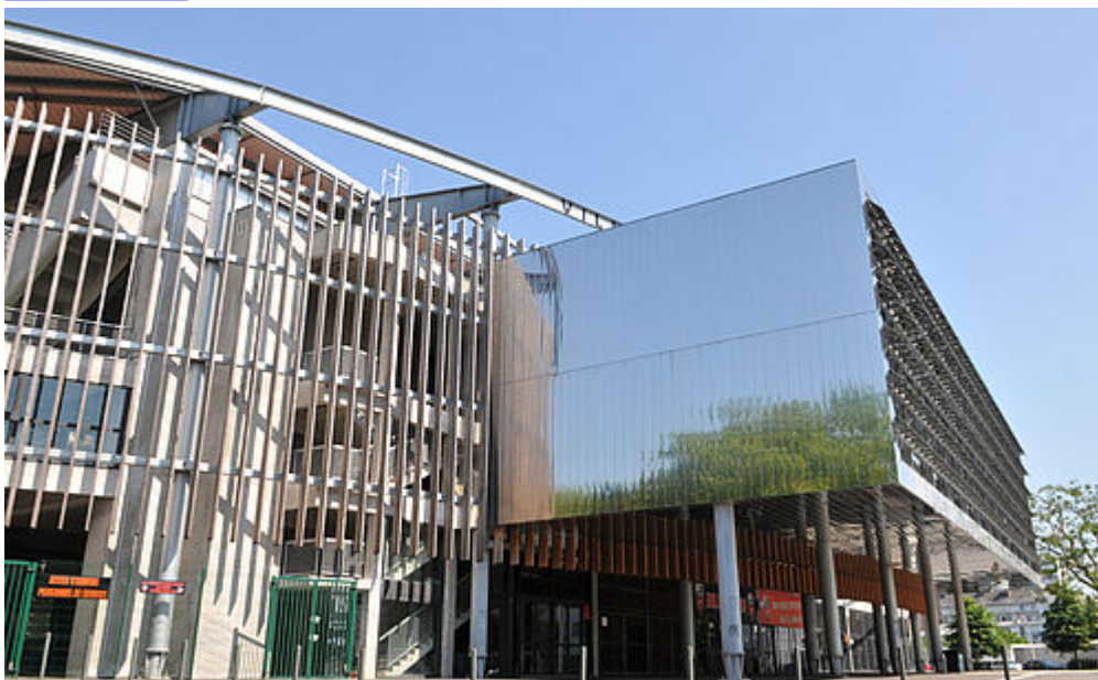
Stade du Moustoir