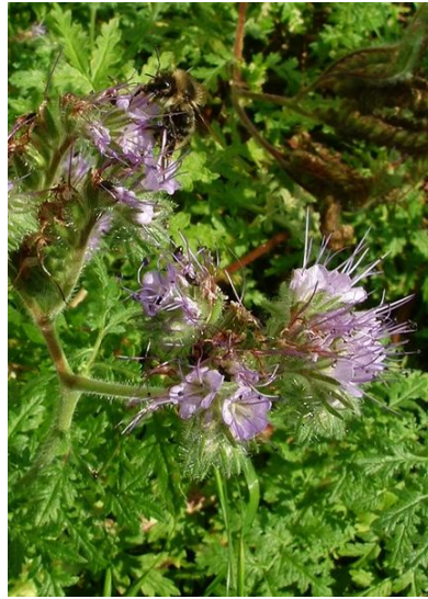
La phacélie, un précieux engrais vert