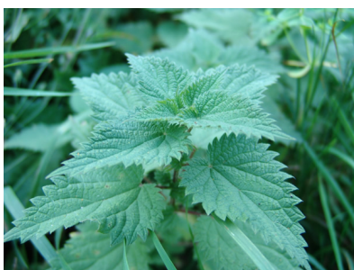
L'ortie, l'amie du jardinier