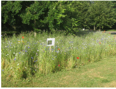
Gestion différenciée, des prairies fleuries