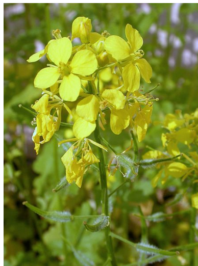
La moutarde blanche enrichit la terre et étouffe les herbes envahissantes