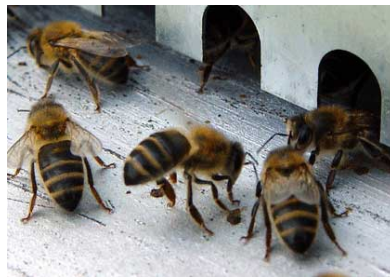
Les abeilles, auxiliaires de biodiversité