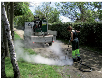
Désherbage à l'eau chaude