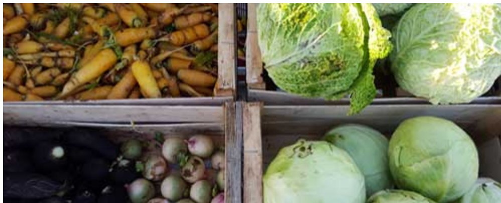
MARCHÉS DE PLEIN