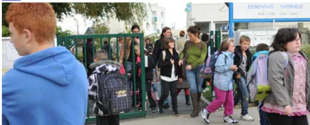
MON ENFANT À