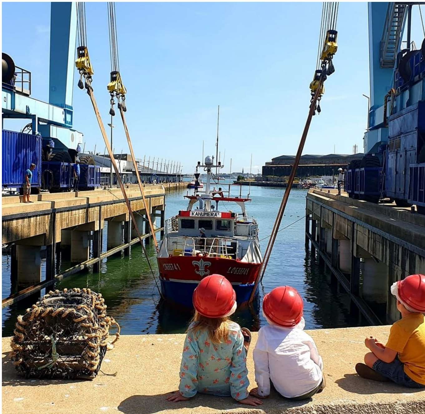
Espace des sciences - Maison de la Mer Agenda