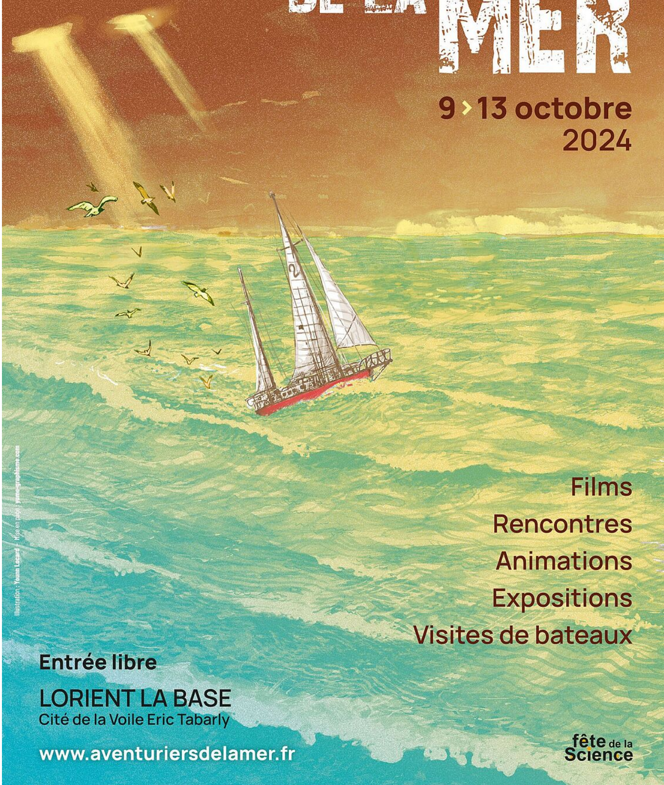
Illustration : Youm Lepard - ifps en page : ymnographama.com

Films Rencontres Animations Expositions Visites de bateaux