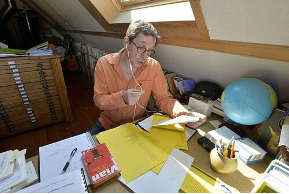
Au bout du fil