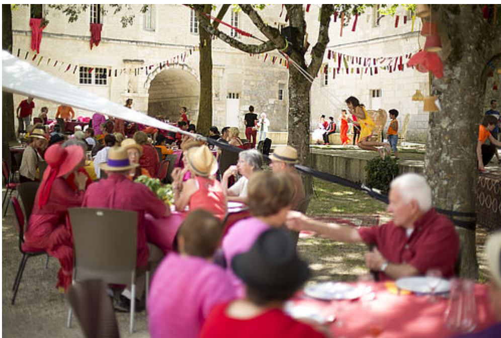
Le Banquet du Grand