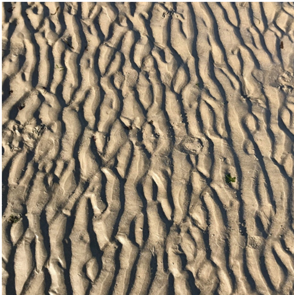
Divaguer - Sable