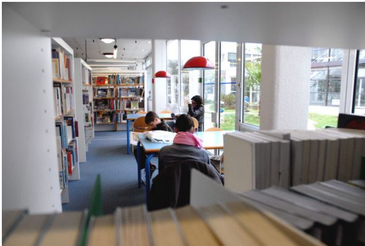
Salle de lecture

- Se détendre : un coin café disponible à la médiathèque François Mitterrand et des espaces confortables pour travailler en solo ou en groupe, venir en famille.