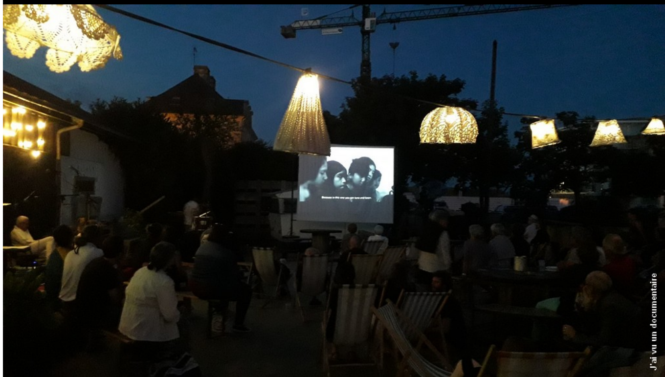
J'ai vu un documentaire

Magie de lumières à Keryado Rendez-vous à l'école de Keryado (36, rue de Kersabiec)