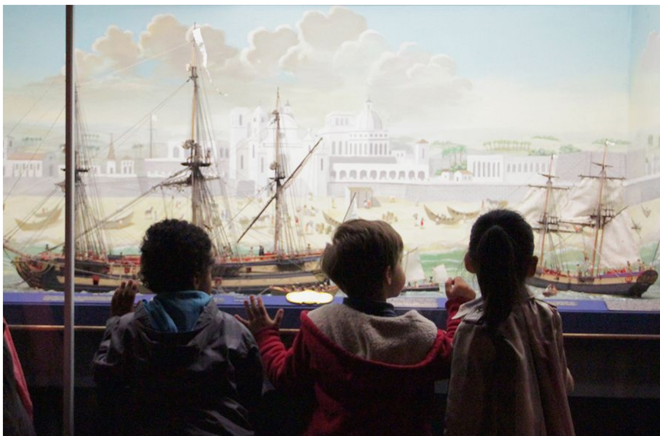
Visite jeune public au musée

L'association des "Amis du musée de la Compagnie des Indes" accompagne le musée dans certains de ses projets et contribue à l'enrichissement des collections.