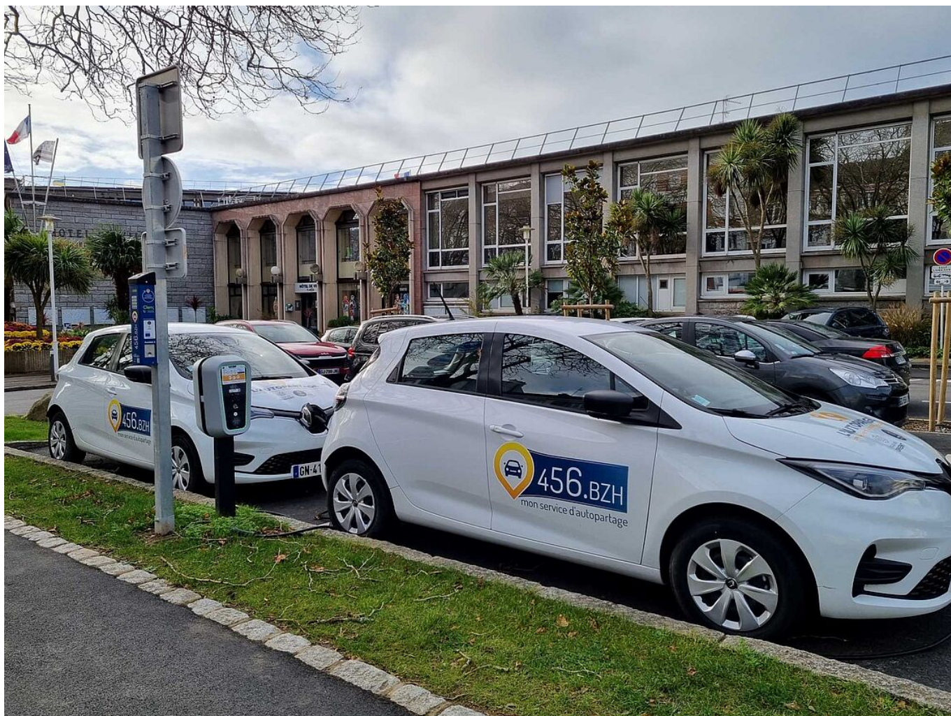
2 véhicules en auto-partage devant la mairie

Accédez à la plateforme sur https://www.456.bzh.clem.mobi/