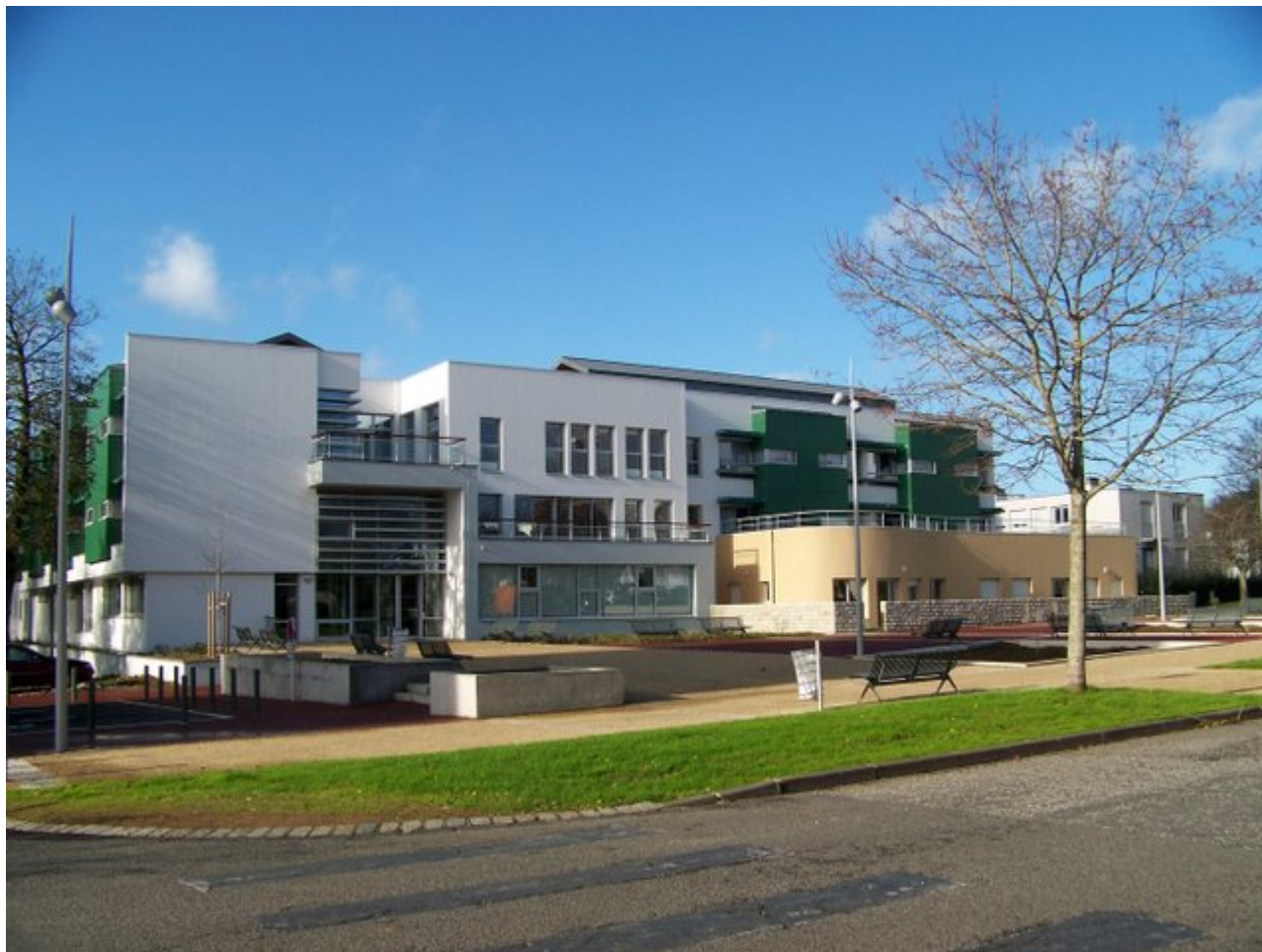
EHPAD, vue d'ensemble