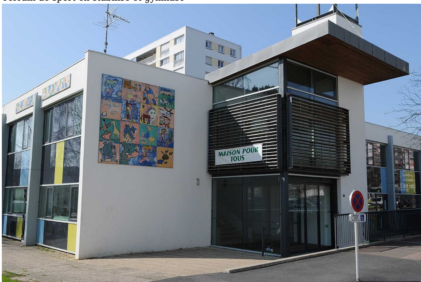
L'entrée du bâtiment rue Maurice Thorez