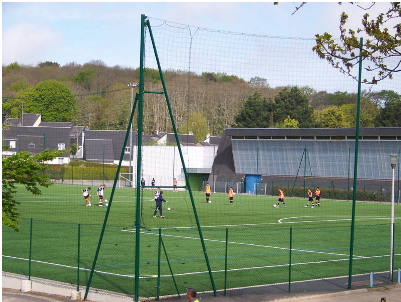
Terrain de sport en stabilisé et gymnase