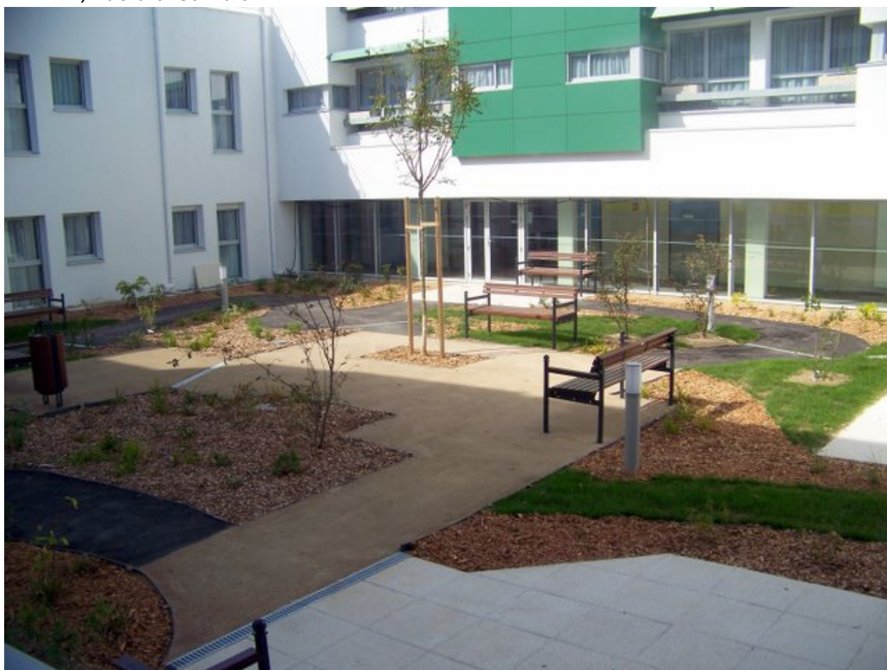
EHPAD, le patio