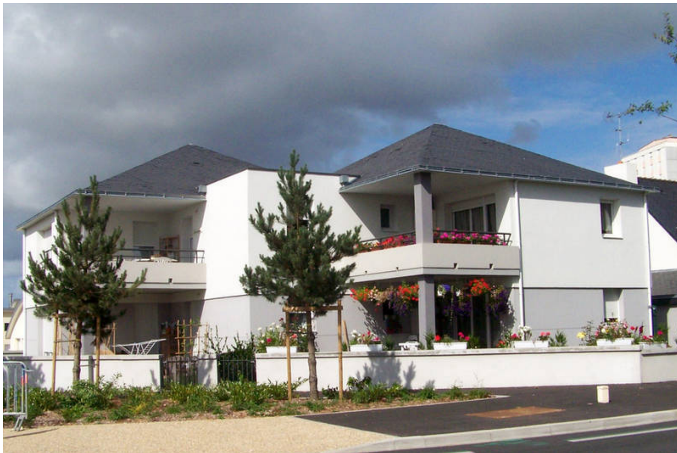
Semi-collectif rue Jules Vallès