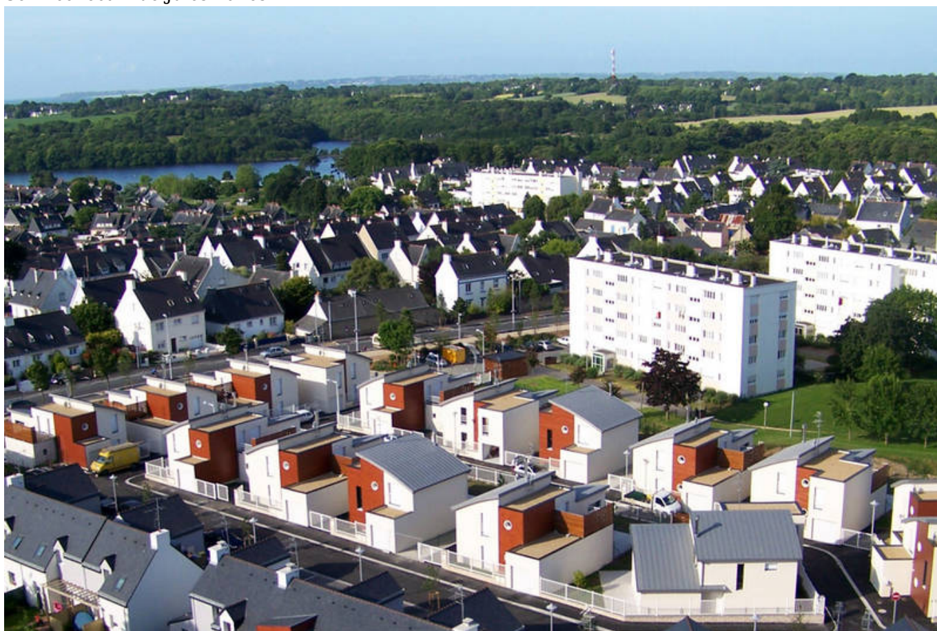
Résidences du Ter