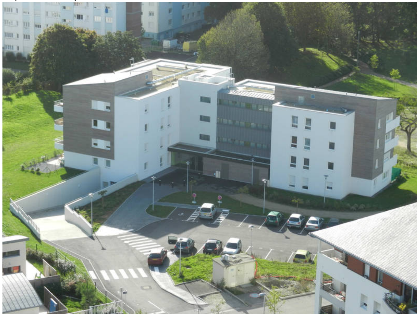
îlot Louise Michel