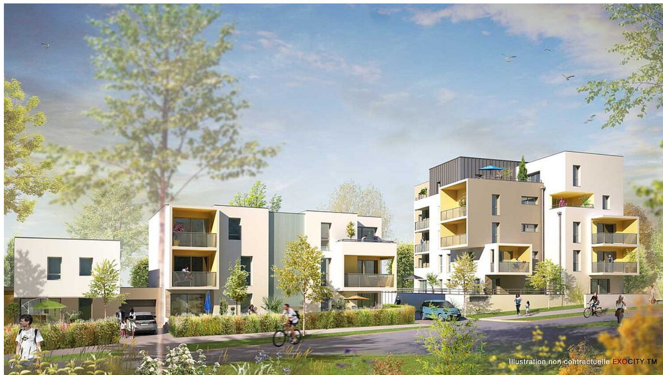
Esquisse des Marquises