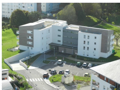
îlot Louise Michel