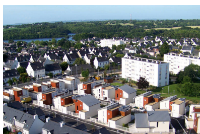
Résidences du Ter