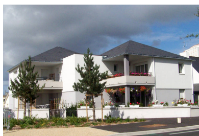
Semi-collectif rue Jules Vallès