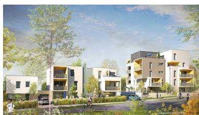
Esquisse des Marquises