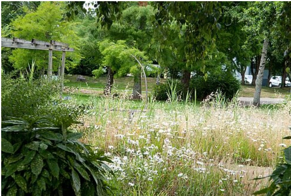
Jardins, parcs et