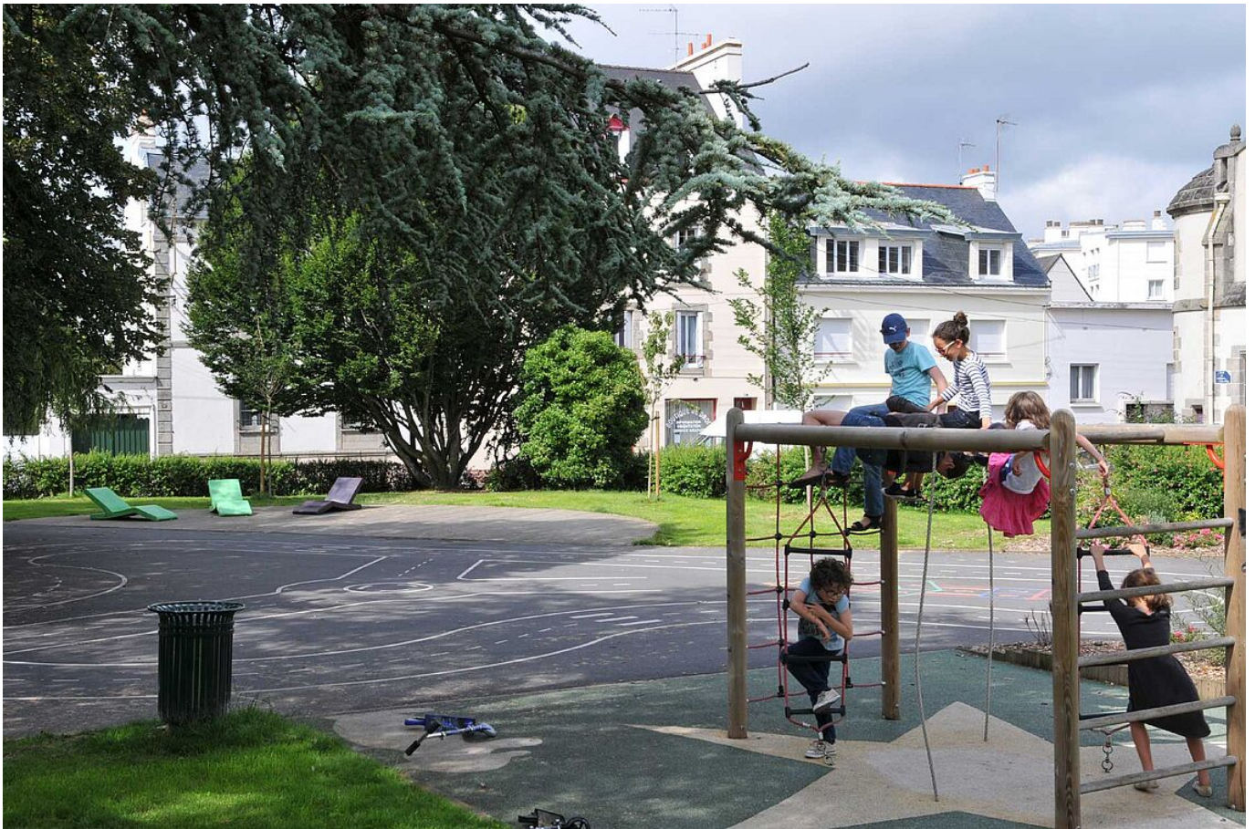
Square Sainte Anne d'Arvor

Il a été entièrement remodelé en 2011 en concertation avec les riverains et usagers. Doté d'une aire de jeux (balançoire, structure à grimper, marelle, circuit pour les vélos), d'un espace convivial avec des chaises fixées en vis à vis, de chaises longues, il est le rendez-vous de toutes les générations.