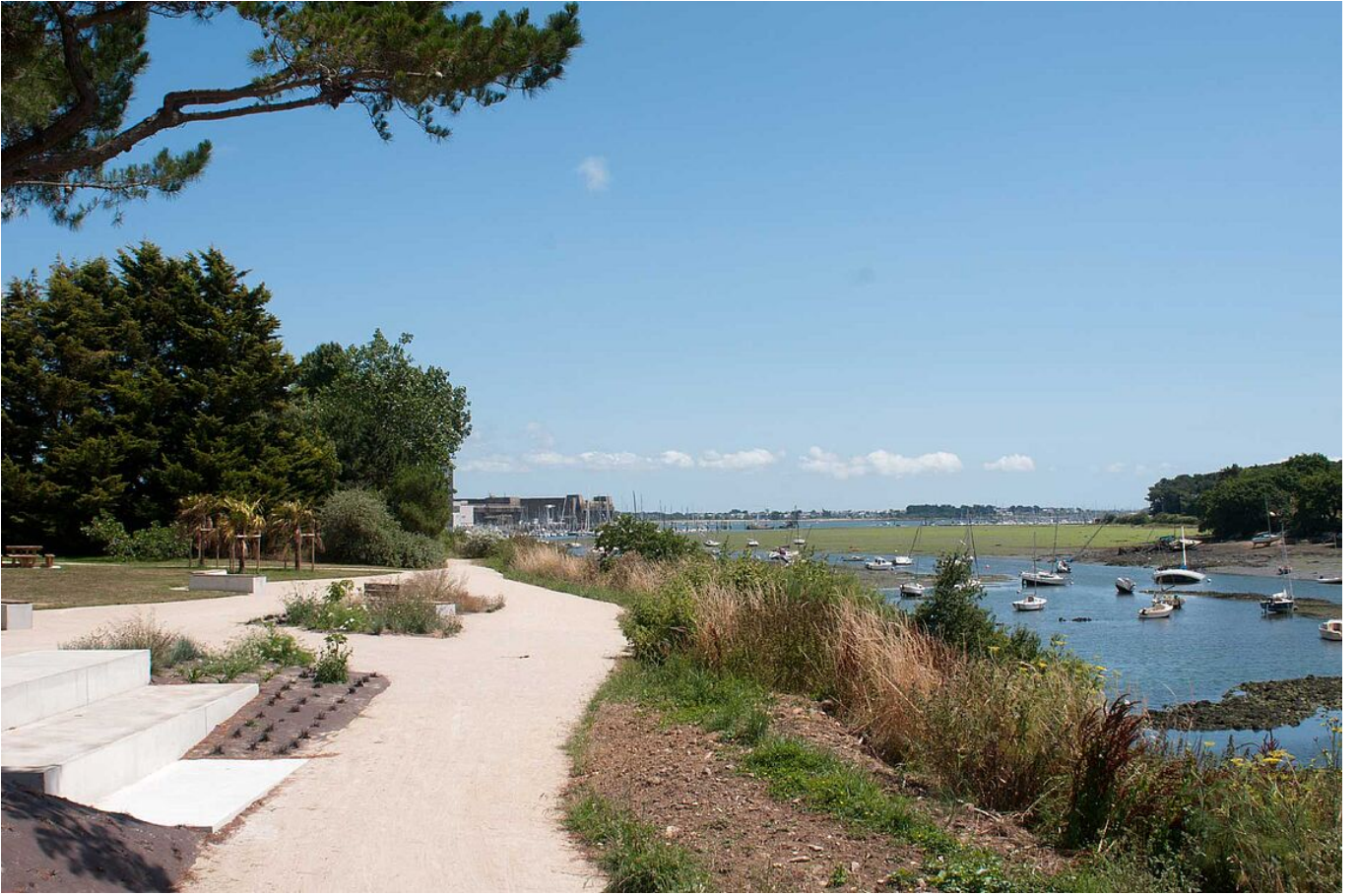
Jardins de l'île de Man