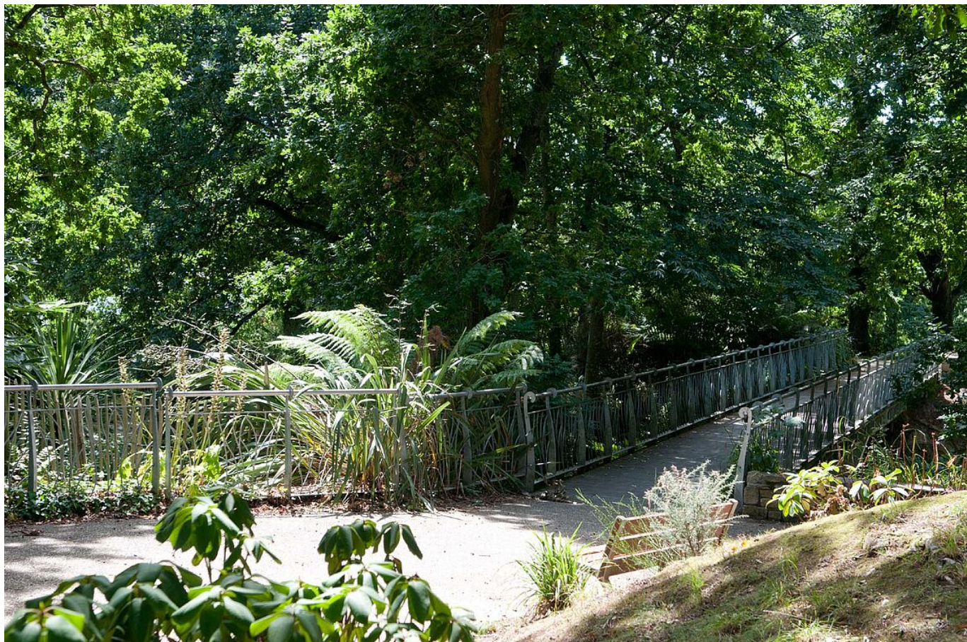
Passerelle du parc du Venzu