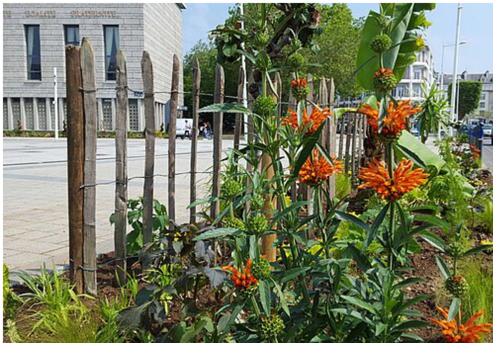
Label Villes et Villages