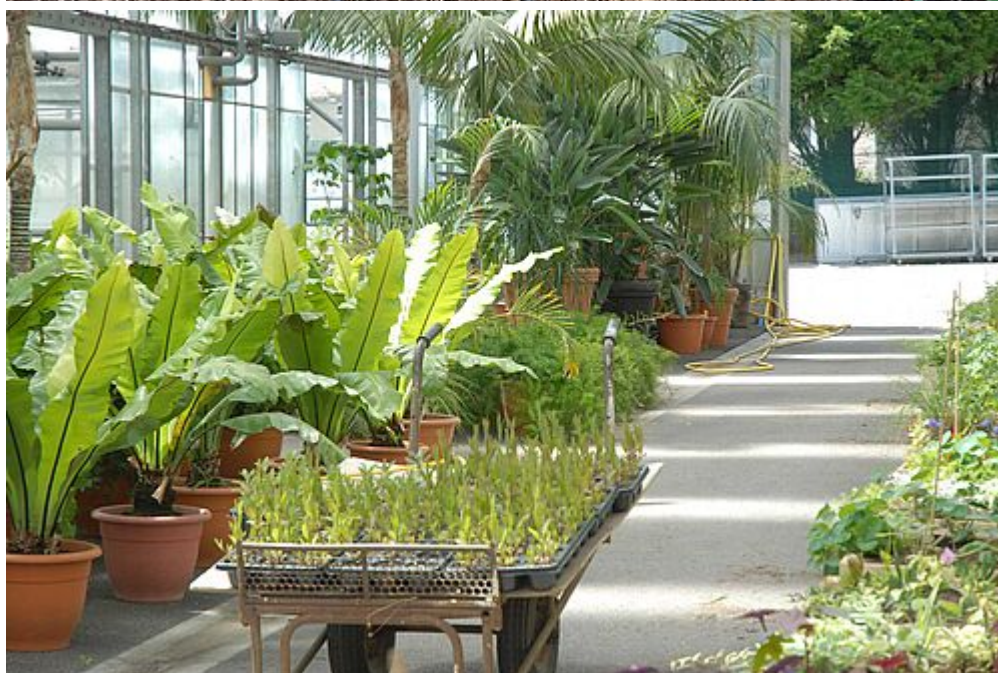
Les serres municipales