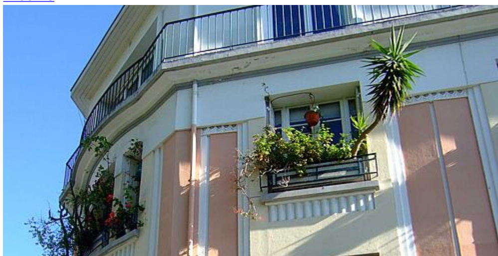
Concours Maisons et