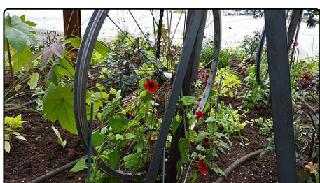
FLEURISSEMENT ET ANIMATION DE L'ESPACE PUBLIC