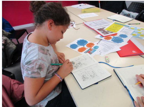
Trouve l'objet caché...