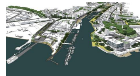
L'aménagement de l'Estacade