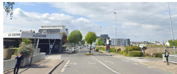
Le futur aménagement de la rue Carnel