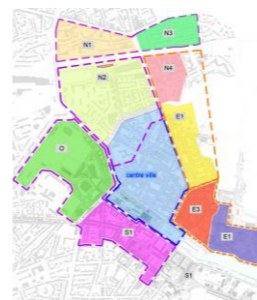
Mon centre-ville demain