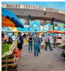
La rénovation des halles de Merville

Les concertations, les co-constructions à venir pour votre CCQ