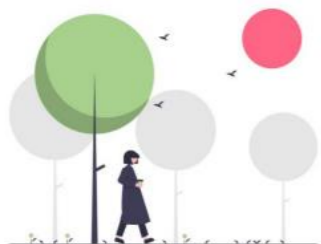
Nature en ville : les projets pour votre quartier