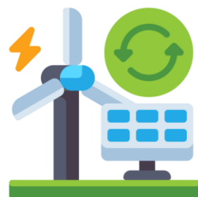
Les enjeux écologiques