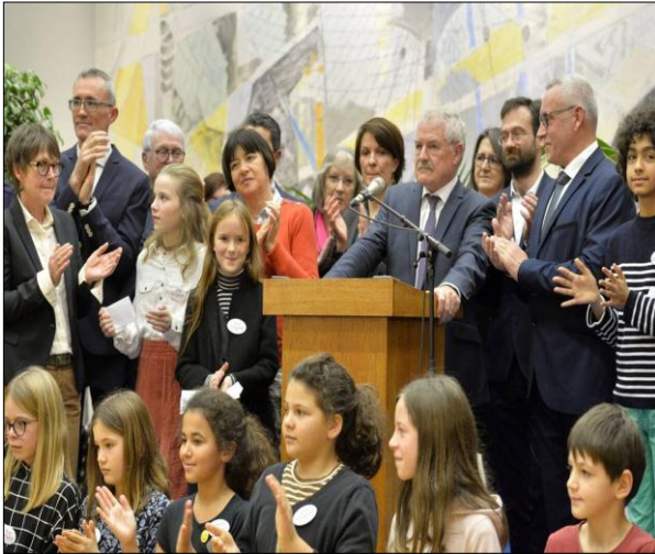
La cérémonie des vœux du maire