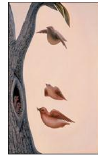
Que voyez-vous ?