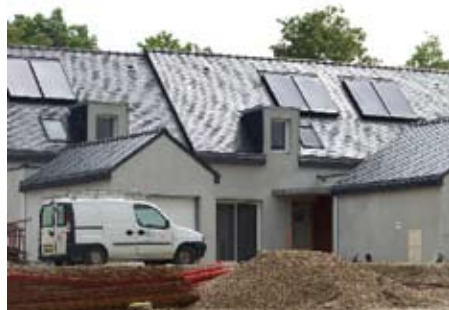
Capteurs solaires sur les maisons en construction rue Jules Vallès

Le plan de rénovation urbaine lancé au niveau national génère une hausse de l'activité du secteur du bâtiment. Ce vaste programme représente un gisement d'emplois considérable. Cependant, il existe un déficit d'intérêt et de formation pour ces métiers. Pour y remédier, des outils sont mis en place notamment la charte d'insertion signée localement dans le cadre de la convention de rénovation urbaine du quartier de Kervénanec. Lorient Habitat comme tous les donneurs d'ordre locaux dans le Morbihan est confronté à la difficulté de trouver les compagnons pour réaliser les chantiers dans certains corps d'état.