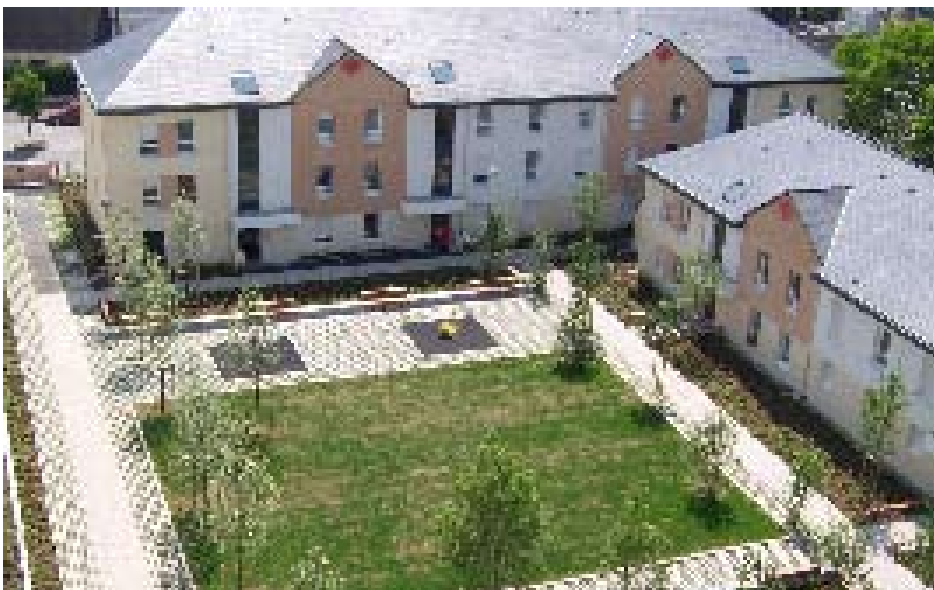
44 familles du secteur des tours ont été relogées dans les immeubles neufs de l'îlot Georges Le Sant reconstruit