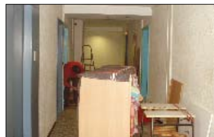
Nos meubles sur le palier de l'ancien logement