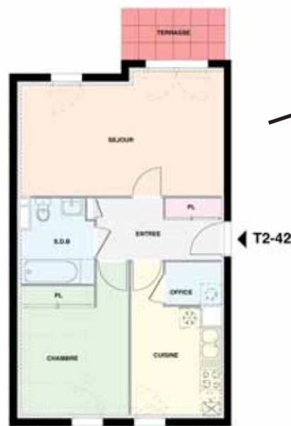
T2 rue Marianne

Un immeuble de 9 logements - Rez-de-chaussée + 1 étage - 2 halls d'entrée - 2 appartements par palier