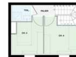
T5 duplex rue Le Sant