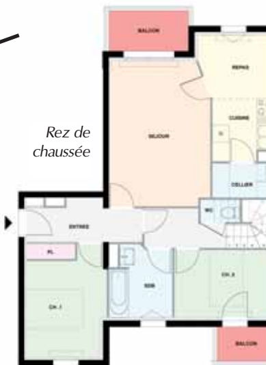
Rez de chaussée

Un immeuble de 27 logements - rez-de-chaussée + 3 ou 4 étages avec ascenseur - 2 halls d'entrée - 3 appartements par palier