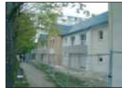
Rue Capitaine Marianne :

La première reconstruction à Kervénanec s'achève. Le nouvel îlot Georges Le Sant sera prêt à accueillir d'ici la fin de l'année 2006 ses locataires. Les 50 logements répartis sur 3 bâtiments se décomposent ainsi : 9 T2, 30 T3, 8 T4, 1 T5 et 2 T6. Chaque bâtiment comprend un local poubelles et un local pour vélos. 27 garages ont été aménagés en sous-sol rue Georges Le Sant et 24 places sur un parking aérien paysager au cœur de l'îlot avec un accès rue de Kervénanec. Un logement témoin pourra être visité après le 15 juin.