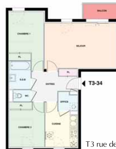
T3 rue de Kervénanec