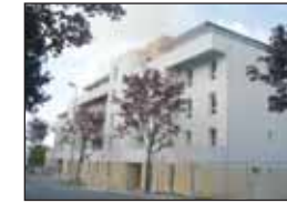
Rue Georges Le Sant :

Un immeuble de 27 logements - rez-de-chaussée + 3 ou 4 étages avec ascenseur - 2 halls d'entrée - 3 appartements par palier