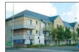
Rue de Kervénanec :

Un immeuble de 14 logements - Rez-de-chaussée + 2 étages - 3 halls d'entrée - 1 ou 2 appartements par palier