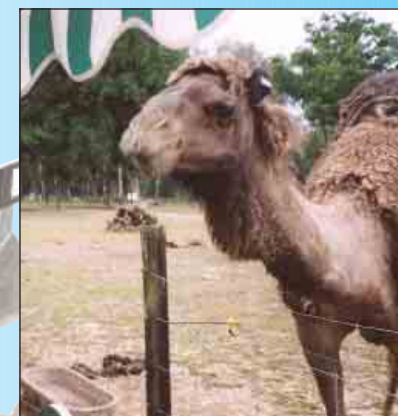
Une bosse pour le dromadaire, deux bosses pour le chameau ...

Juillet et août sont les mois des vacances. On les prépare longtemps à l'avance. On les attend avec impatience ... C'est l'évasion. Combien de vacanciers ont eu la chance de partir en autocar découvrir la ferme du monde ... ça laisse rêver ! Tropical parc, une autre aventure, le petit train dans le parc de Trévarez, la calèche sur le chemin de halage oubliant la canicule, la traversée pour l'île de Groix sous un soleil radieux où nous avons apprécié le festival du film insulaire. Habitants de Kervénanec, nous remercions tous les animateurs de la Maison Pour Tous qui chaque année nous proposent un programme de qualité qui permet à ceux qui ne partent pas de vivre d'une façon améliorée la période estivale.