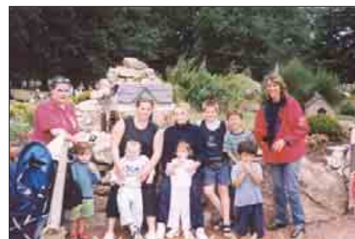
Mamans et enfants à la ferme du monde " à Carentoir le mercredi 16 juillet ...

Le défilé des musiciens au Festival de l'accordéon à AUGAN (56) le dimanche 20 juillet ... Musette et musiques traditionnelles