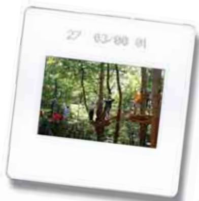
On défie les lois de l'équilibre au parc " accrobranches " de Camors

Avec les jeunes, l'été 2003 a été un bon " cru ". Les animations proposées ont été bien suivies et ajustées à la demande. Pour exemple : la pêche, les marchés nocturnes ou encore les ateliers boomerangs, les visites à Quimper, Vannes, Carnac ont recueilli bon nombre de participants.