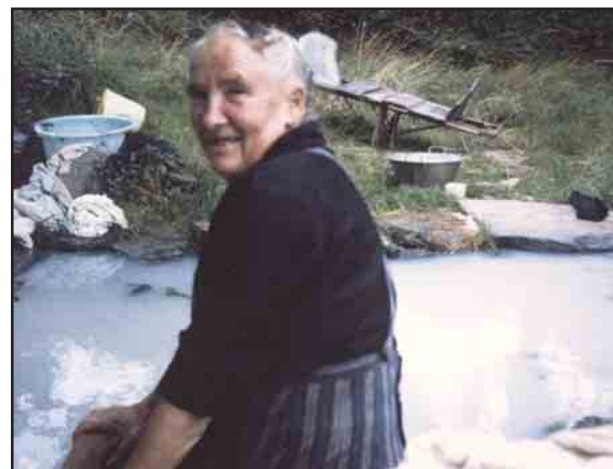
Une habitante de village au Douet vers 1970

Yvette Théberge, Paul Le Duff, René Lamezec