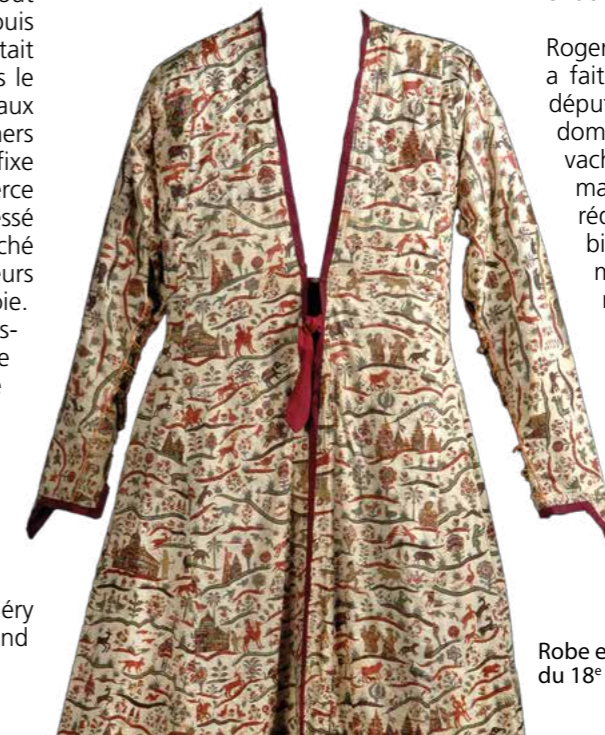
Robe en cotonnade du 18 e siècle