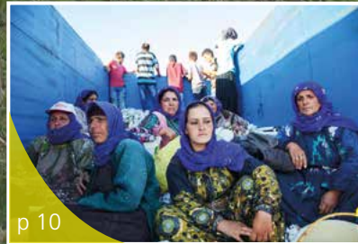
La maison du projet