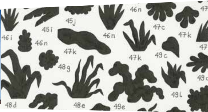
Jochen Gerner RG - Série ectoplasme, matière colorante verte