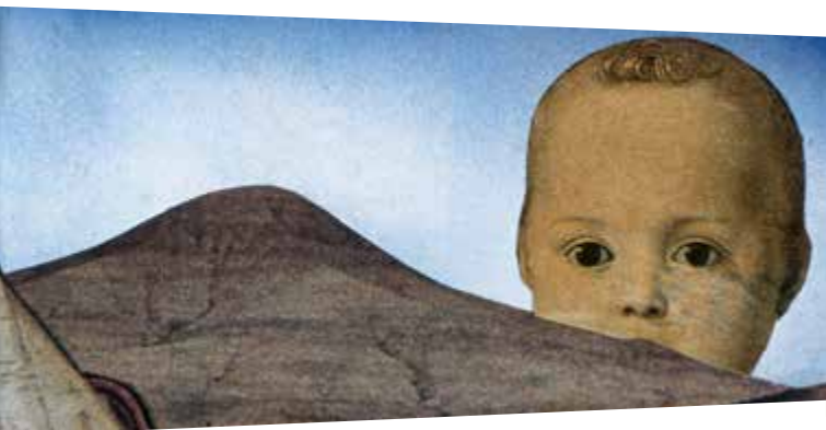
Roman Cieslewicz Annette (détail), 1975 de la série « les mystères d'Udolfo » - FNAC 33606 (16) Centre national des arts plastiques

Programme complet des Itinéraires graphiques : http://itinerairesgraphiques.lorient.fr