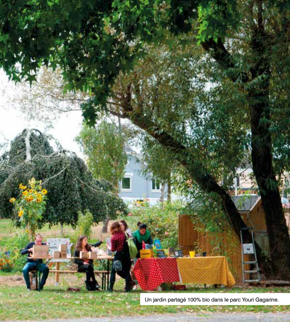
Un jardin partagé 100% bio dans le parc Youri Gagarine.