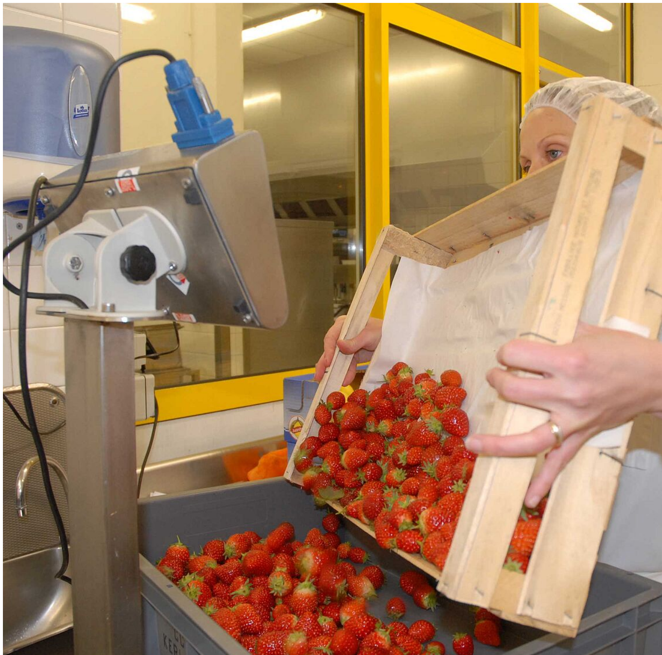
Pesée des fraises