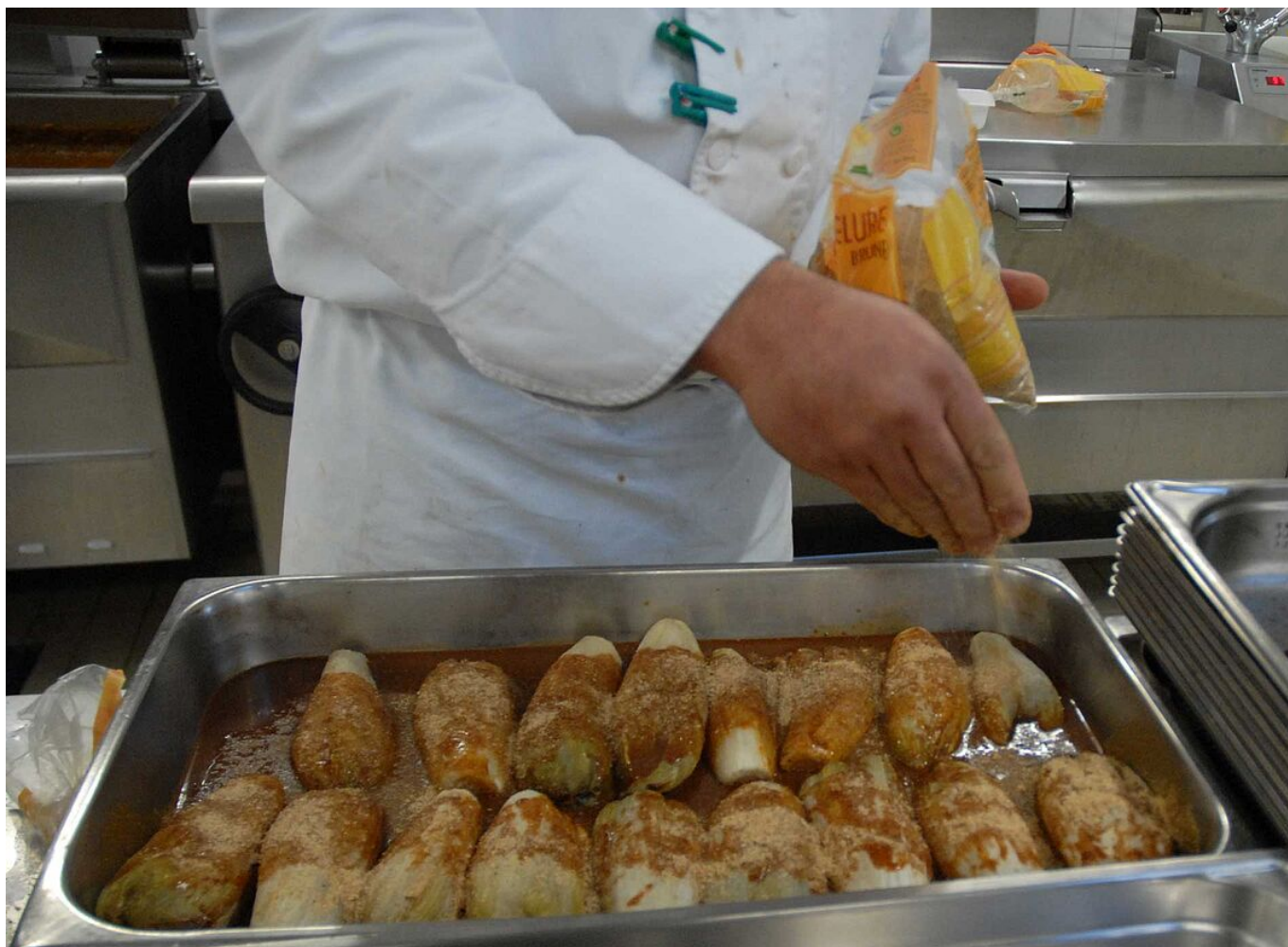
Préparation d'un gratin d'endives