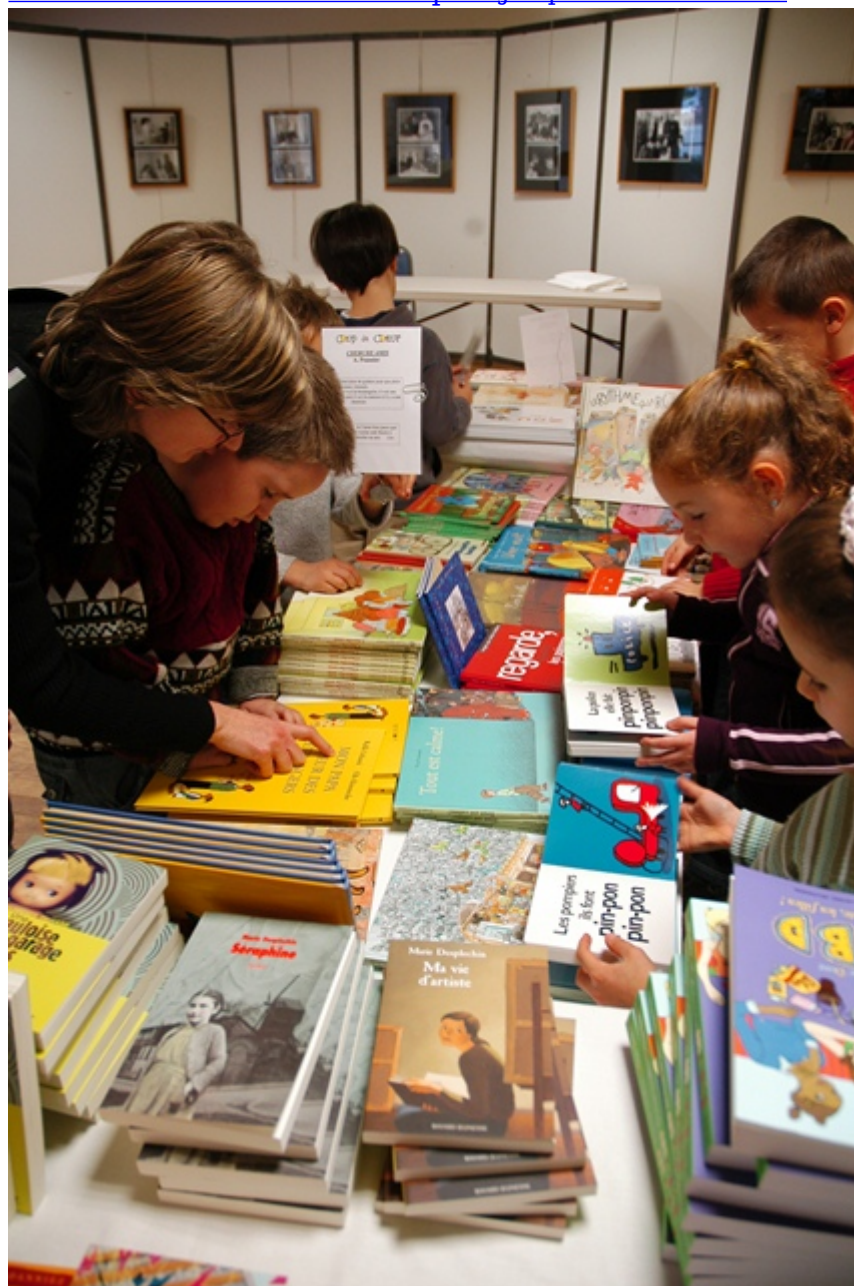
Salon du Livre Jeunesse du pays