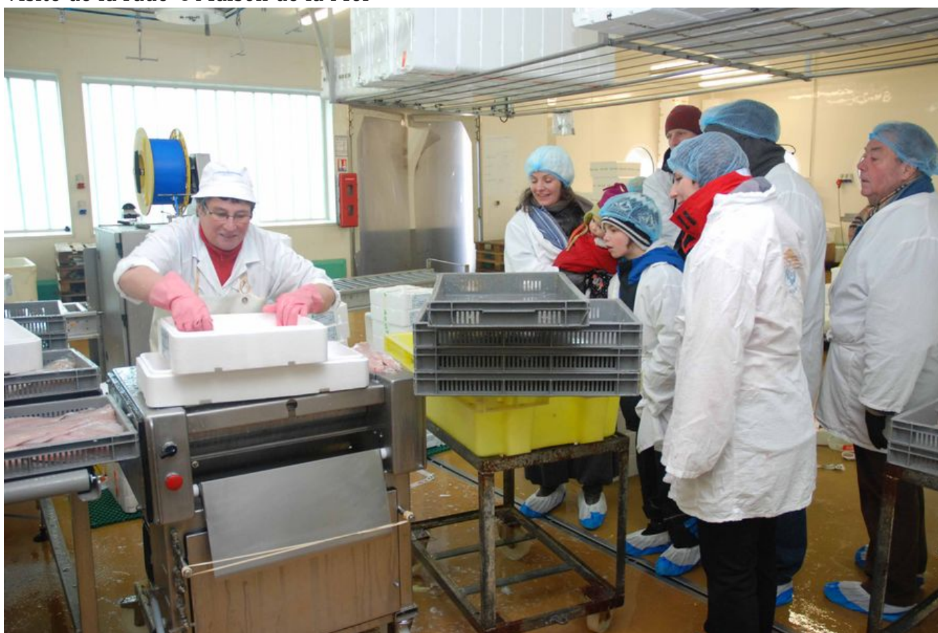
Visite entreprise de mareyeur