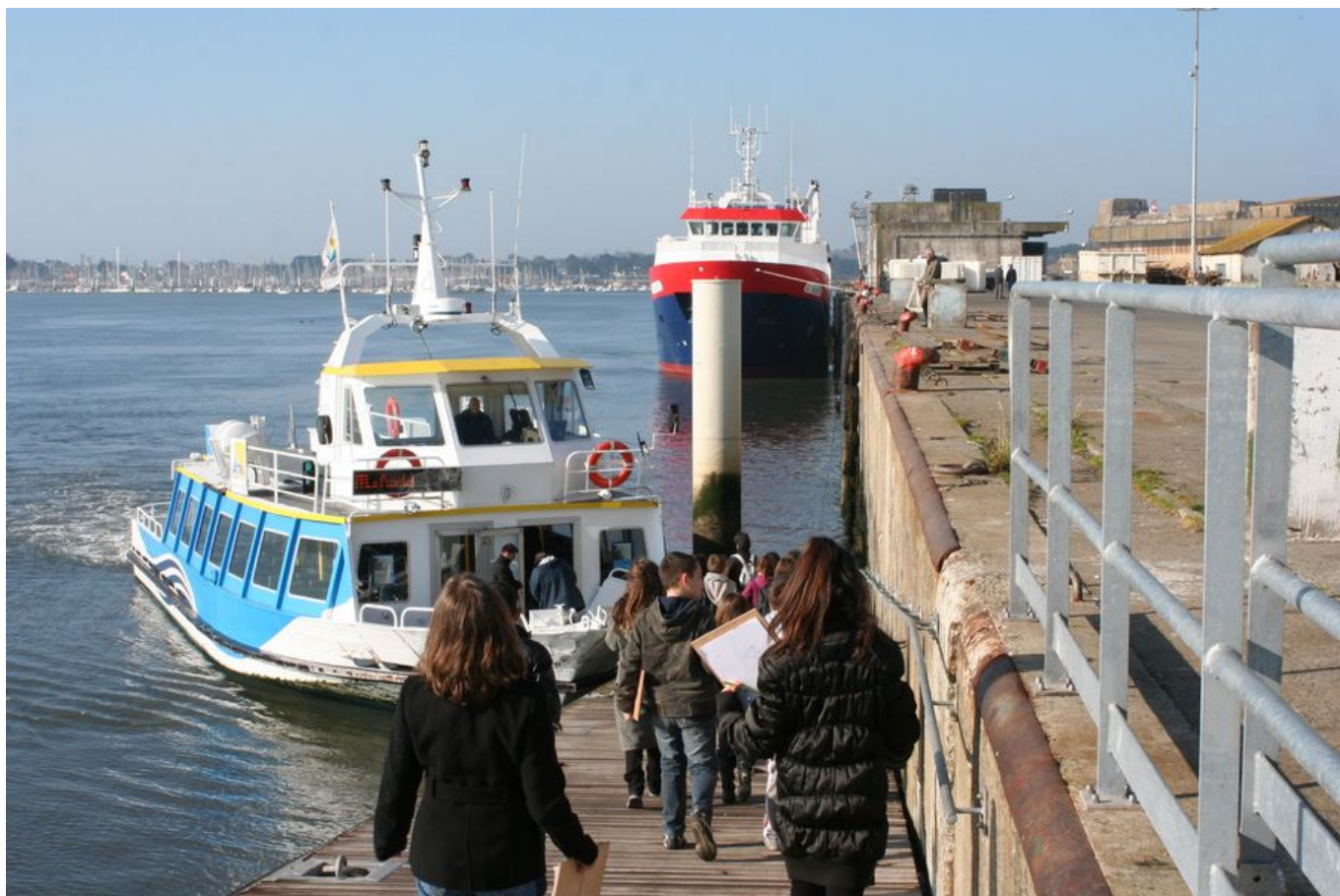
Visite de la rade