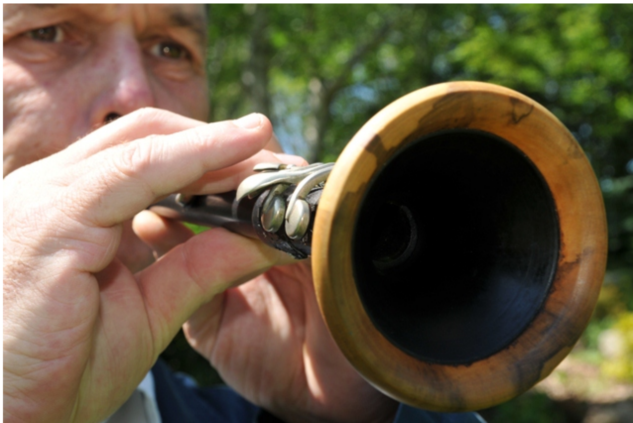
Joueur de bombarde

Livret de présentation des musiques traditionnelles au Conservatoire de Lorient