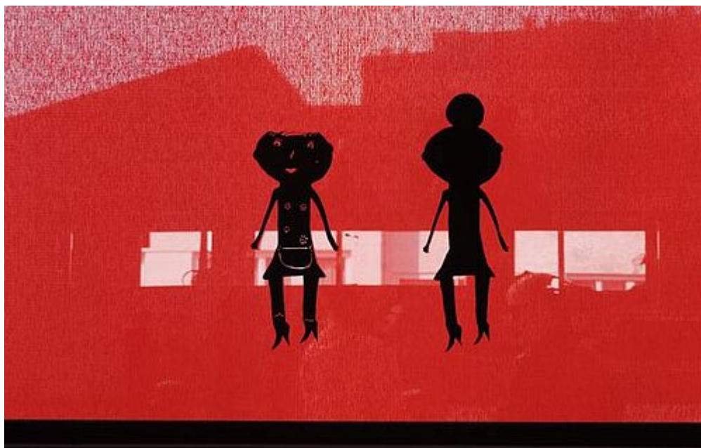
UN CAILLOU DANS