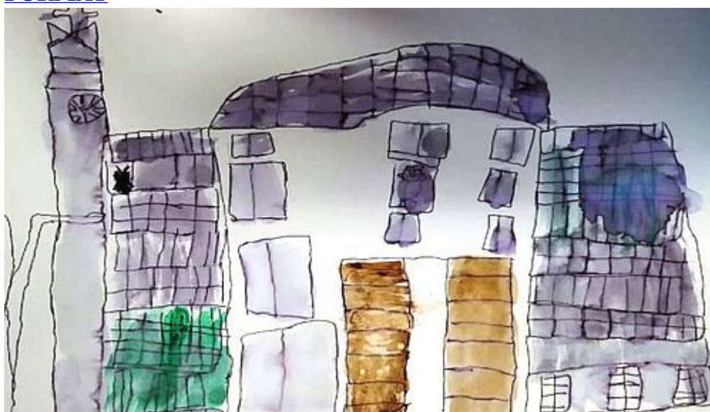
LIBÉRATION DE LA