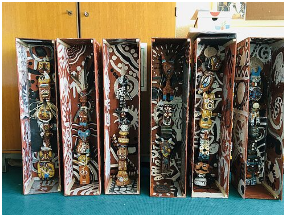
RÉCRÉATIONS // CIE