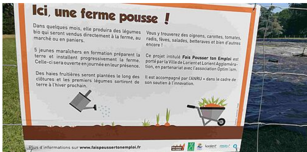
Une micro-ferme dans le parc du Bois du Château

À Bois du Château, les interventions se poursuivent sur la future entrée ouest.