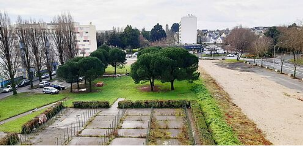
Les projets de

construction en cours: l'entrée du quartier et la chaufferie bois