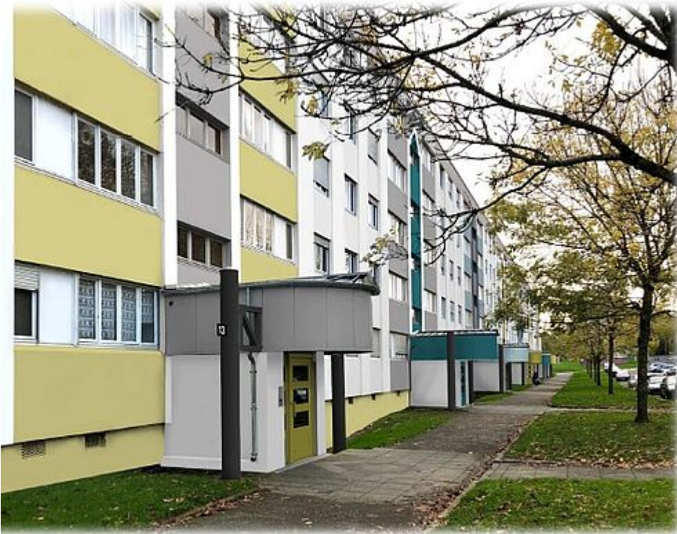
Les projets de

construction en cours: l'entrée du quartier et la chaufferie bois