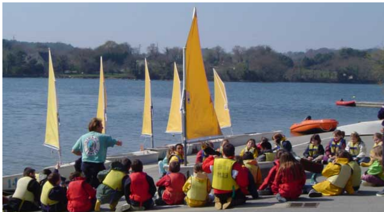
Une classe à la base nautique du Ter