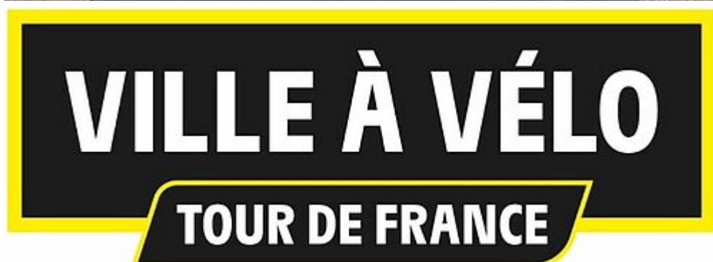
Label Ville à vélo