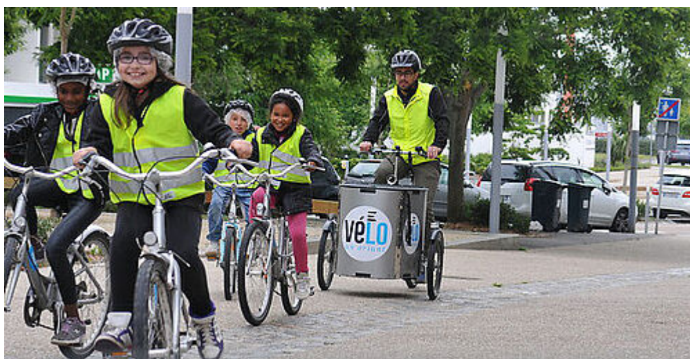
Lorient ville cyclable