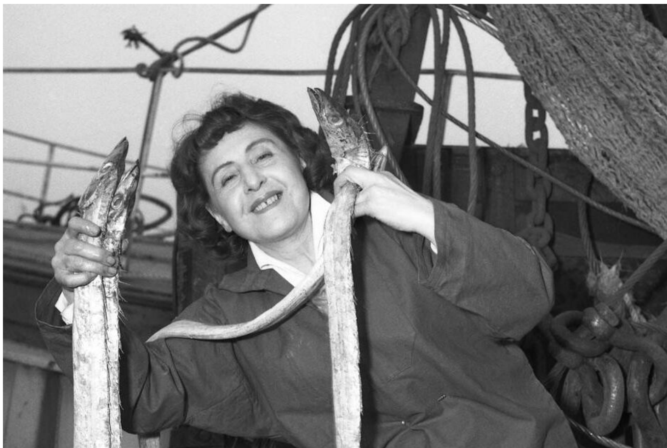
Anita Conti (1899-1997) Ecrivaine, relieuse d'art, photographe et océanographe