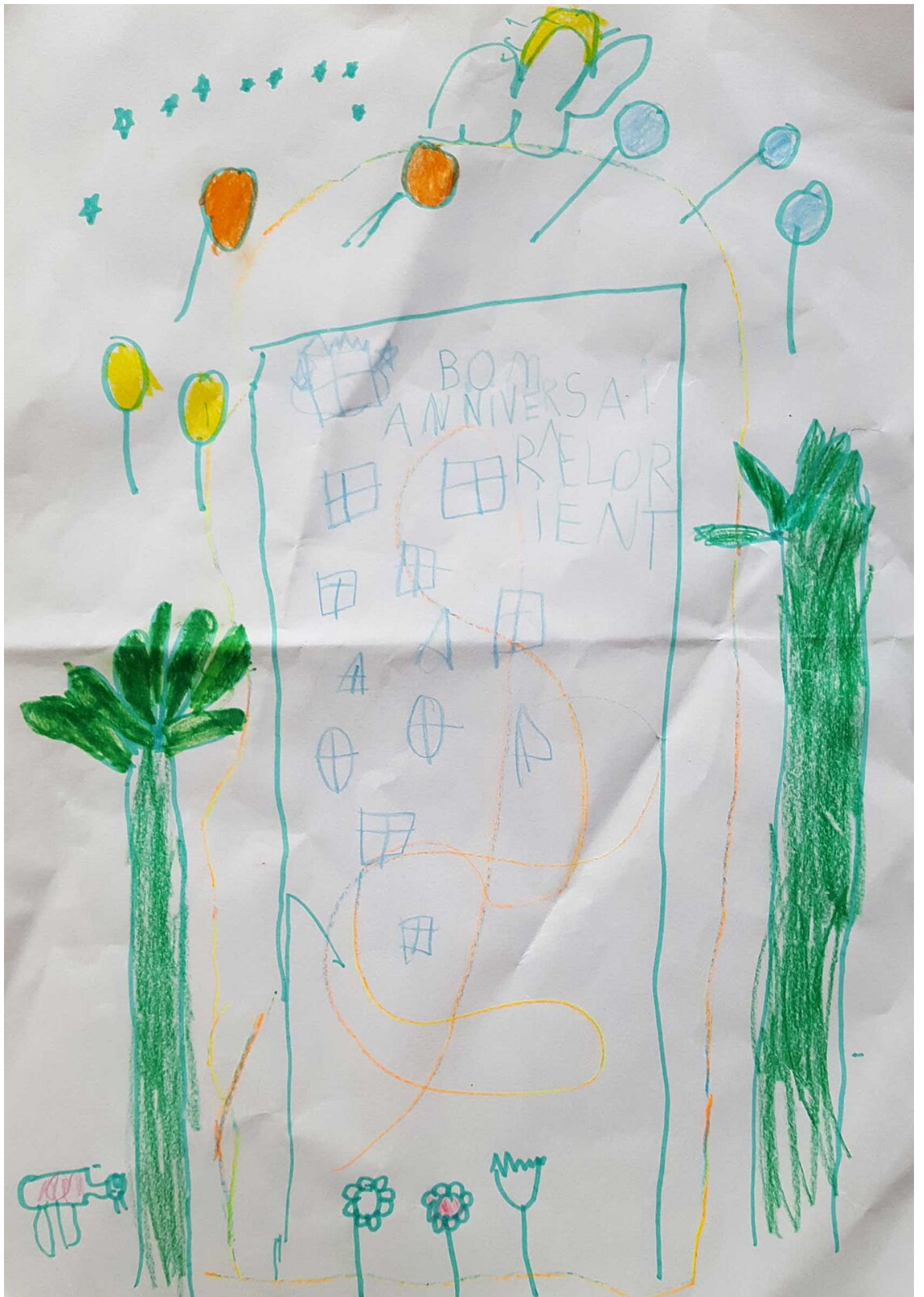
Carte d'Adèle Crouzatier