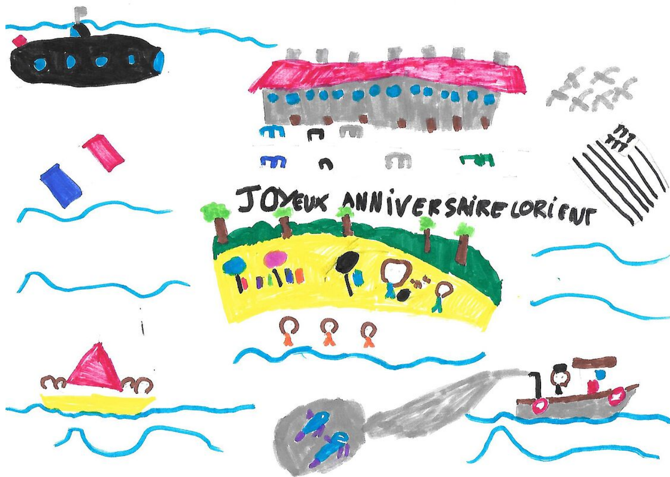
Carte de Zoé Peyran