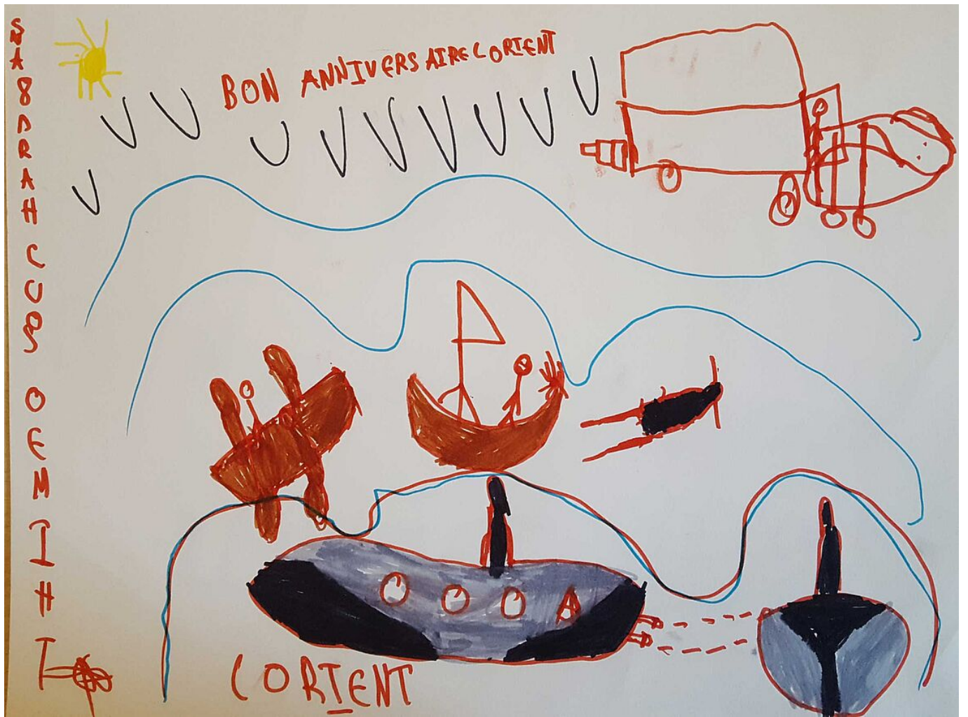
Carte de Thiméo Souchard