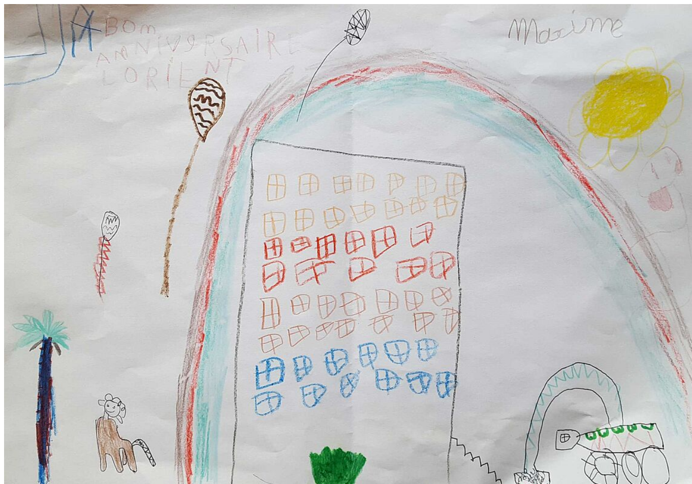
Carte de Maxime Crouzatier