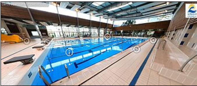
Visite virtuelle du centre aquatique