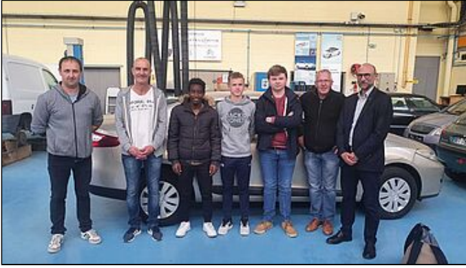
Concours des Meilleurs apprentis de France