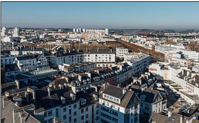
Rénovation de votre copropriété : la Ville vous accompagne