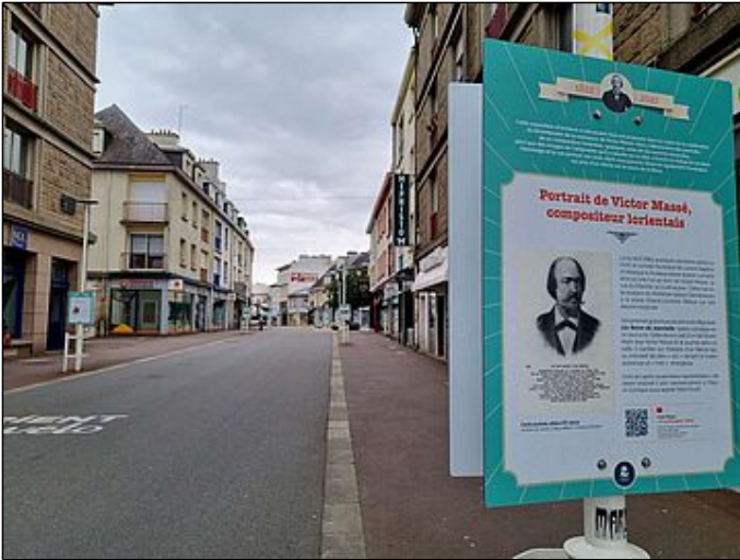
Hommage à Victor Massé