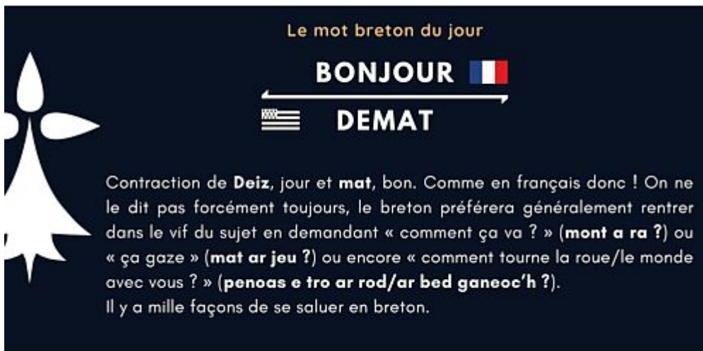
DESKIT UR GER